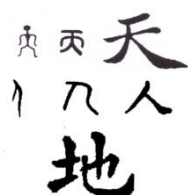
Afbeelding 6. Tian Ren Di

De mens is een onderdeel van het Universum. Het is een microkosmos in deze macrokosmos en ontvangt energie van zowel de hemel (Yang) als de aarde (Yin). De mens is een schakel tussen hemel en aarde. Zo ontstaat een belangrijk concept in de Chinese filosofie: Tian Ren Di of Hemel-Mens-Aarde. Om de Balansmethode te kunnen toepassen, maakt men gebruik van drie correspondenties: Meridiaan correspondenties, Holografische correspondenties en de Weefsel correspondenties.