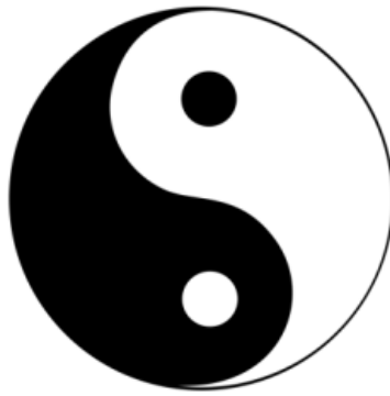
Afbeelding 2. Taiji symbool

Een optimale balans nastreven in het lichaam is het grootste doel binnen de Chinese Geneeswijzen. Hoe meer men in balans is, hoe gezonder men is op alle vlak en des te beter ook onze contacten met de buitenwereld zijn. Dit hele verhaal is gebaseerd op het streven naar evenwicht tussen Yin en Yang. Het Taiji symbool geeft de balans van Yin en Yang weer.