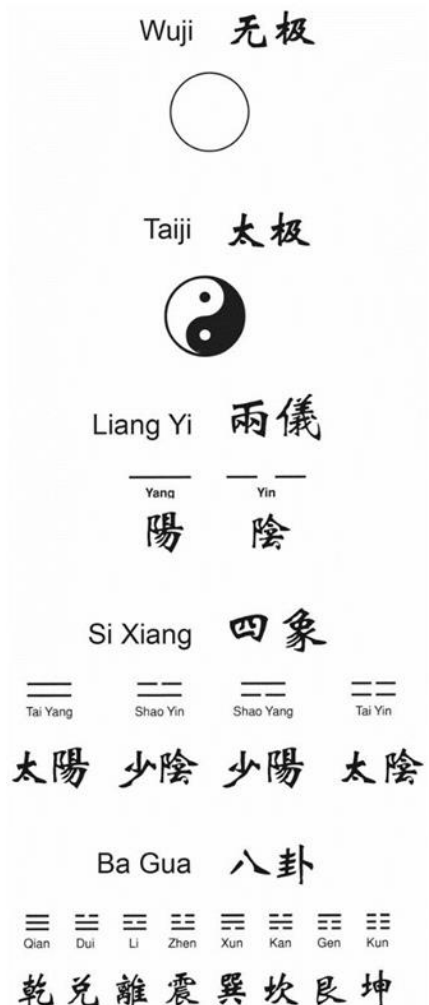
Afbeelding 4. Het ontstaan van de Ba Gua

"Yin Yang is de weg van hemel en aarde, de wetmatigheid en principe van de 10.000 dingen, vader en moeder van verandering en transformatie, oorsprong van leven en dood....." (Su Wen Hst 5). Chinese kosmologie is de evolutie van Wuji naar yin yang qi naar de 10.000 dingen. Dit resulteerde in een cyclisch wereldbeeld (in tegenstelling tot een lineair wereldbeeld), waarbij alles in een voortdurende verandering is. Omdat alles steeds weer terugkeert in haar oorsprong, ontstaat het cyclische wereldbeeld. Elk fenomeen kan worden uitgedrukt in Yin en Yang. Yin Yang vormen de principes hoe Qi zich manifesteert. Deze voortdurende verandering kunnen we